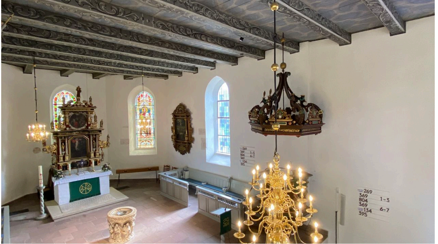
21-09 St.-Ulrichs-Kirche_innen (2).jpeg