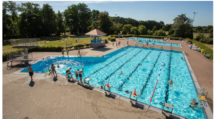
freibad-14 - © Maren Markus