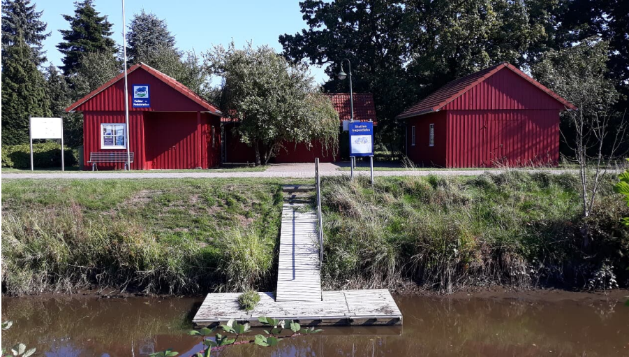
Paddel und Pedal Station