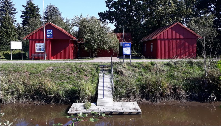
Paddel und Pedal Station