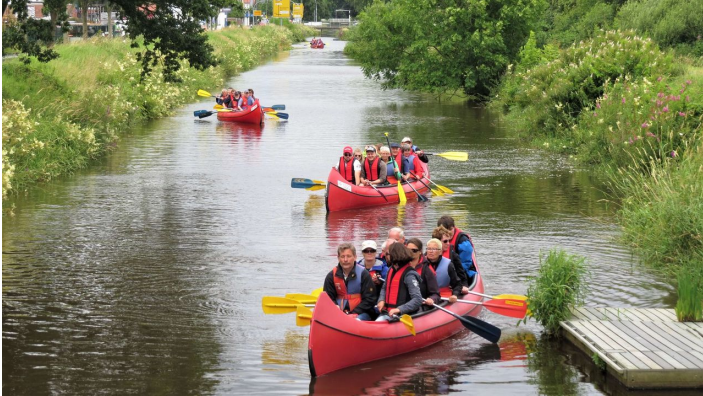
Paddler auf dem Augustfehn Kanal

Quelle: destination.one ID: p_100035951 Zuletzt geändert am 24.05.2024, 12:26