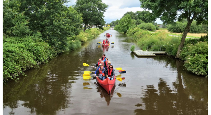
Paddler auf dem Augustfehn Kanal