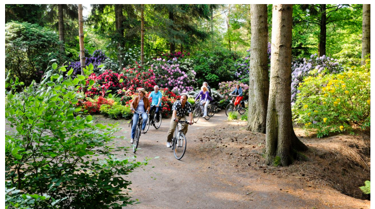
Radfahren im Rhodopark