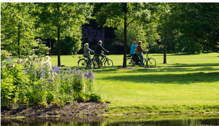
Radfahren im Rhodopark