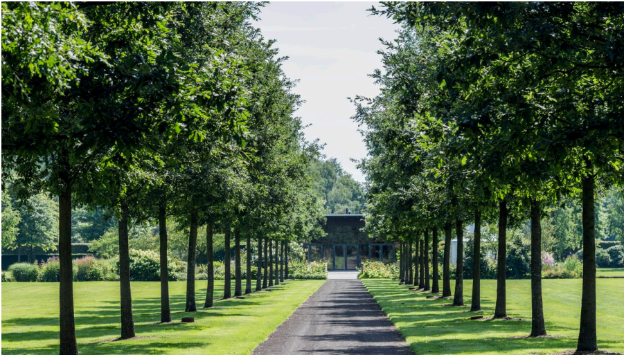
Allee zum Parkpavillion