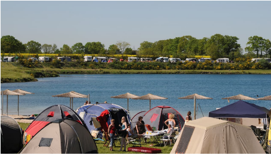
Camping am Bernsteinsee