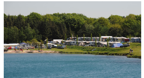
Camping am Bernsteinsee - - info@ferienpark-bernsteinsee.de