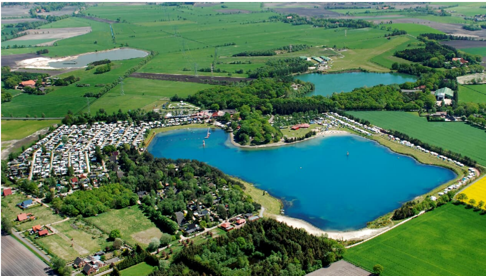
Luftaufnahme Bernsteinsee