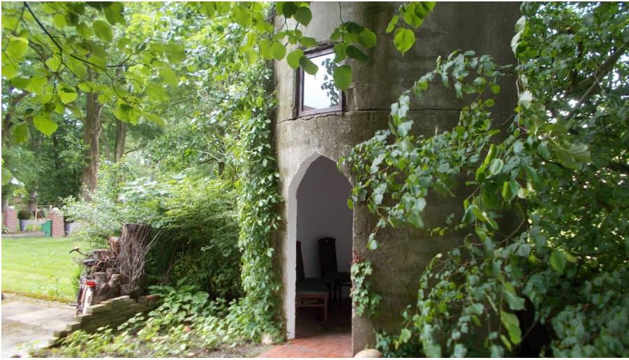
Kapelle "Unter den Linden"