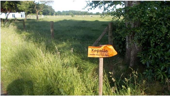
Kapelle "Unter den Linden" Wegweiser