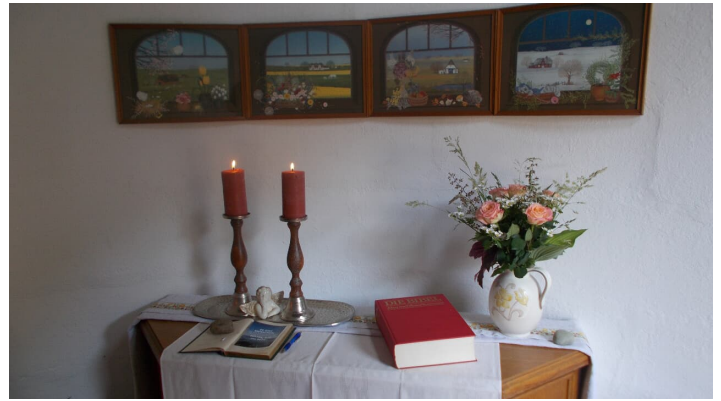
Kapelle "Unter den Linden"