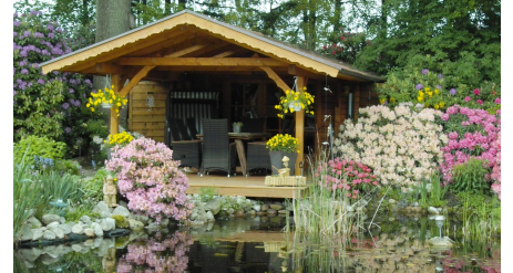
Teichanlage mit Gartenhütte