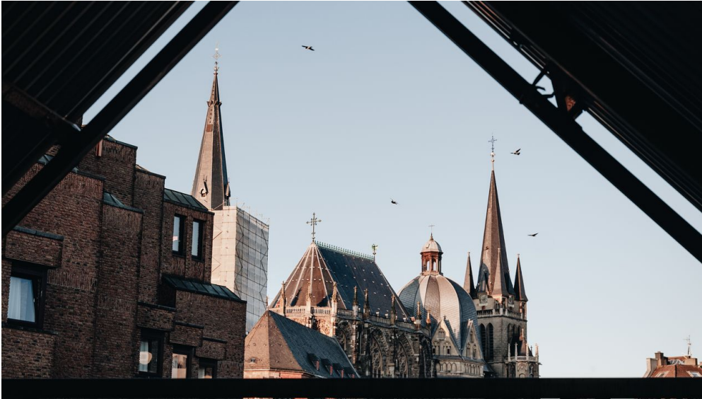
Aachener Dom