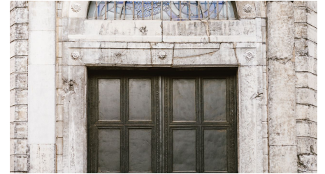
Aachener Dom Wolfstür