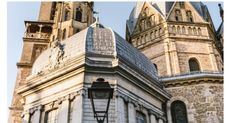
Aachener Dom vom Münsterplatz