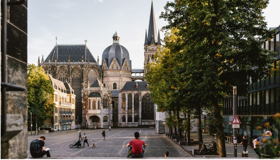
Aachener Dom vom Katschhof