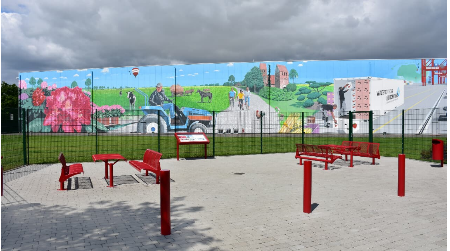
Gemälde Lager 3000