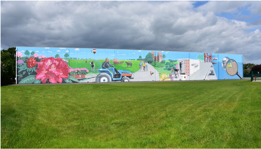
Gemälde Lager 3000