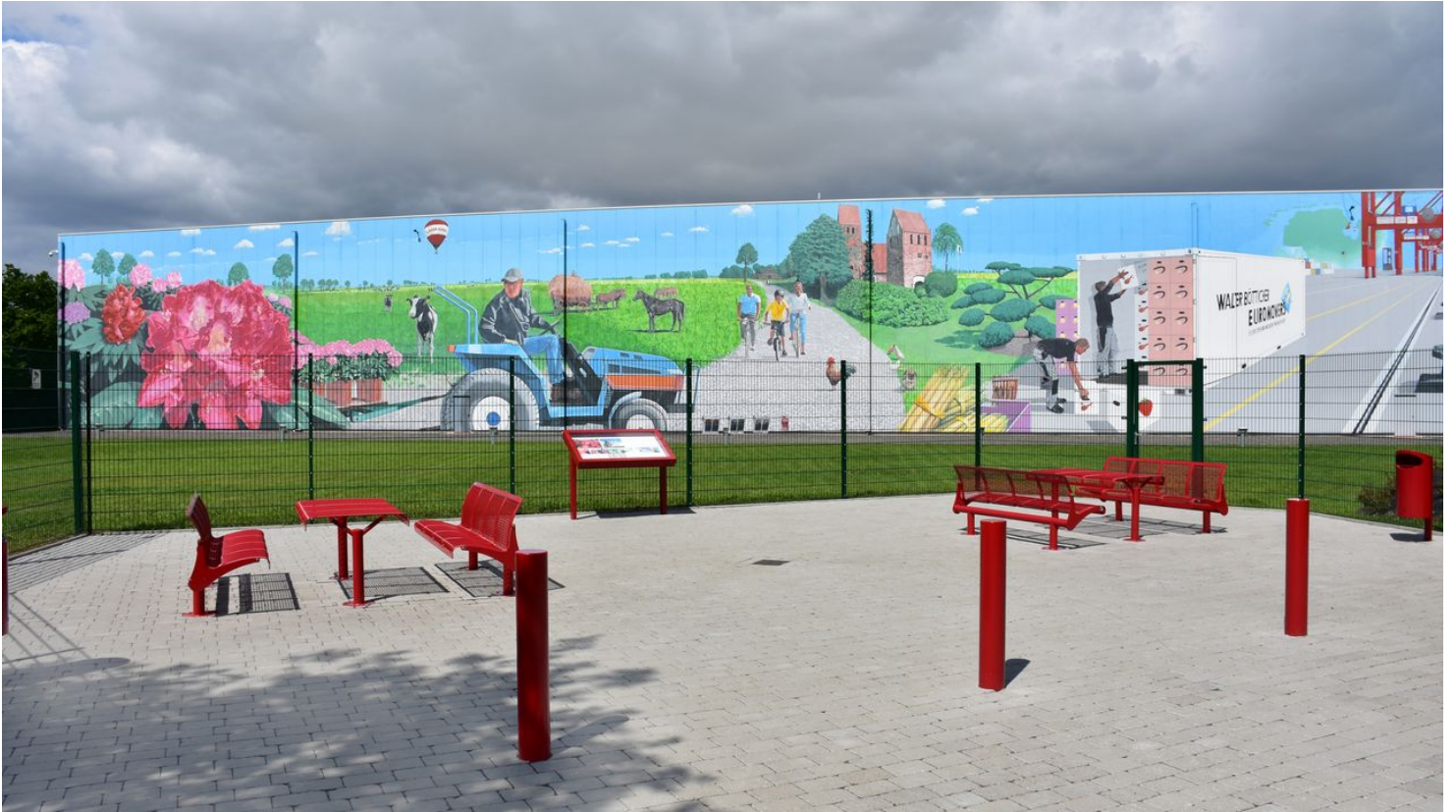
Gemälde Lager 3000

Quelle: destination.one ID: p_100036623 Zuletzt geändert am 22.02.2024, 09:42