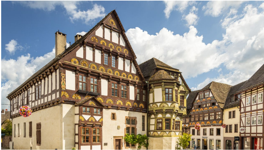
Hoexter-Stadtrundgang-Stadt Hoexter-D. Ketz-2023-096.jpg