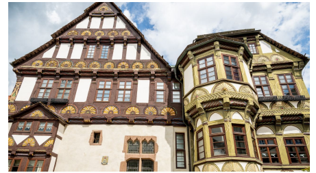
Hoexter-Stadtfuehrung-Stadt Hoexter-D. Ketz-2023-125.jpg