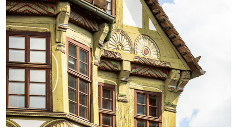
Hoexter-Stadtrundgang-Stadt Hoexter-D. Ketz-2023-091.jpg