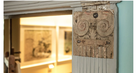
Hoexter-Forum Jacob Pins-Stadt Hoexter-D. Ketz-2023-150.jpg