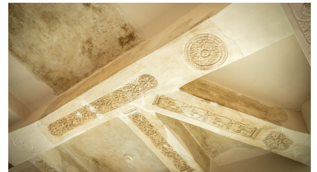
Hoexter-Forum Jacob Pins-Stadt Hoexter-D. Ketz-2023-153.jpg