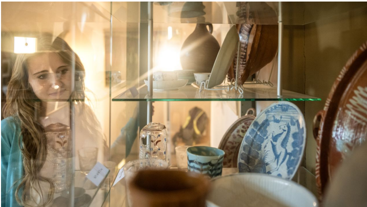
Hoexter-Forum Jacob Pins-Stadt Hoexter-D. Ketz-2023-152.jpg