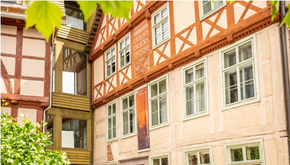
Hoexter-Forum Jacob Pins-Stadt Hoexter-D. Ketz-2023-157.jpg

Der Adelshof kann zu den Öffnungszeiten des Forum Jacob Pins betreten werden. Der Eintritt ist kostenpflichtig.