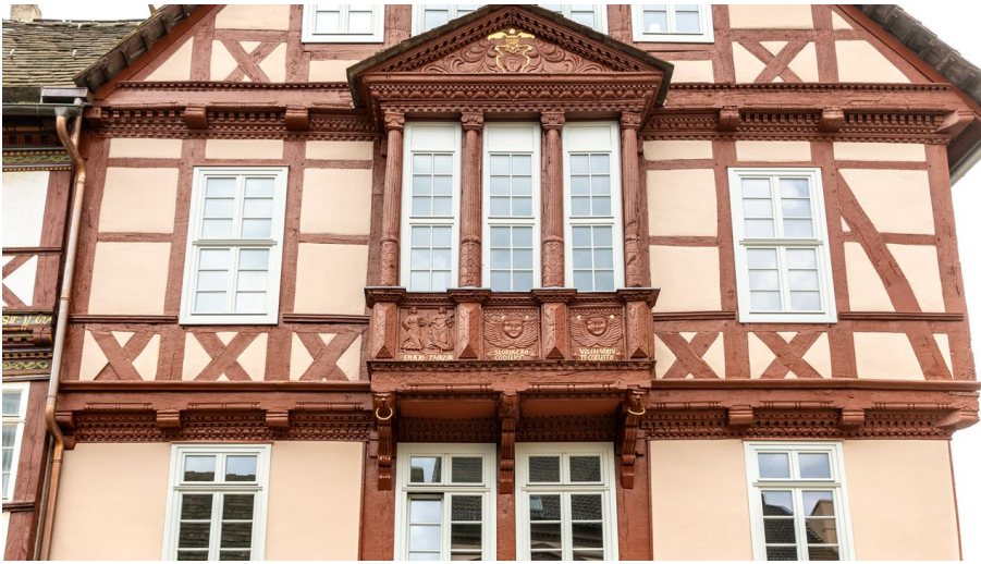
Hoexter-Forum Anja Niedringhaus-Stadt Hoexter-D. Ketz-2023-135.jpg