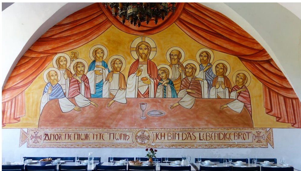
Der Speisesaal mit Szene des letzten Abendmahls.JPG