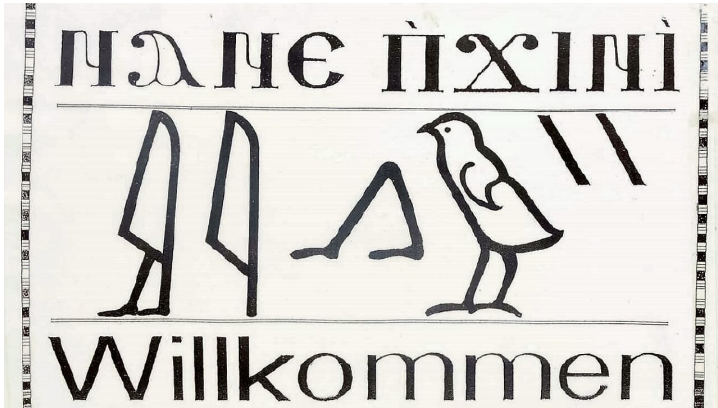
Willkommen-Schild am Klostereingang in Koptisch und Ägyptisch.jpg