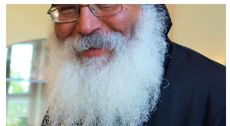
S.E. Bischof Damian (2).JPG