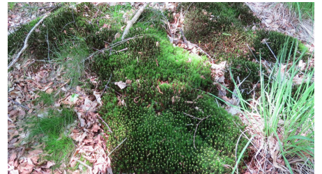
Moosweg an der Kieskuhle Roggenmoor