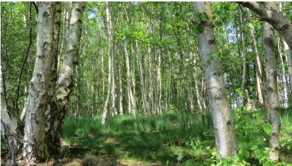
Moorbirken an der Kieskuhle Roggenmoor