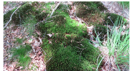
Moosweg an der Kieskuhle Roggenmoor