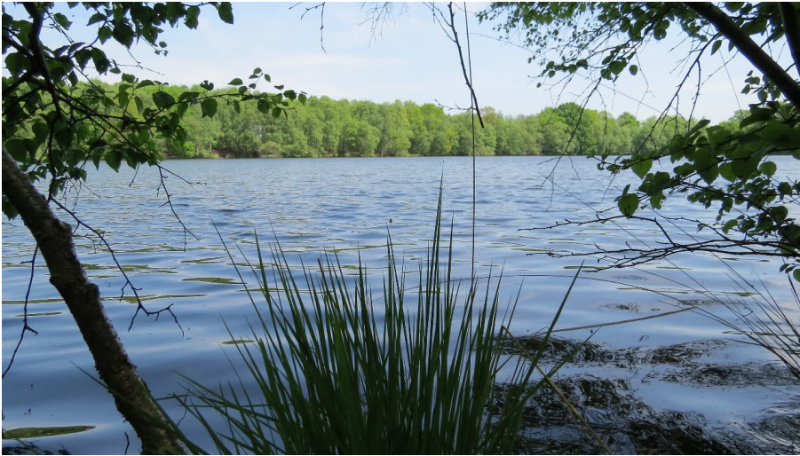
Idyllische Kieskuhle Roggenmoor