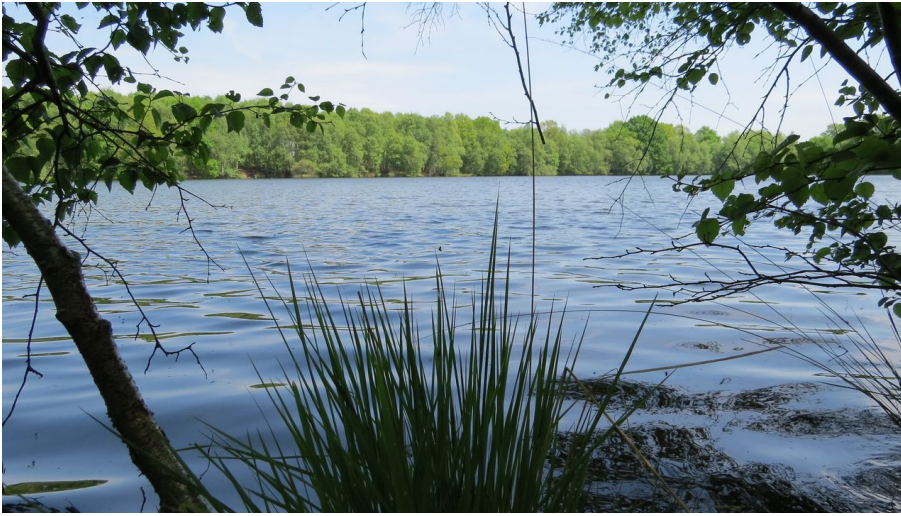
Idyllische Kieskuhle Roggenmoor