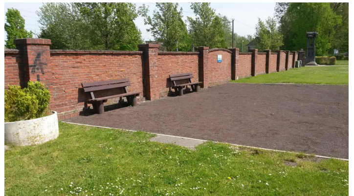
Bouleplatz Augustfehn - © Sandra Hinrichs