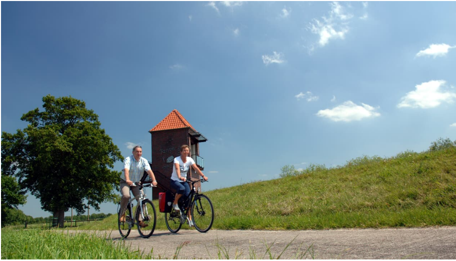
Radlerpaar_Landschaftsfenster_Wasser - © Tobias Trapp