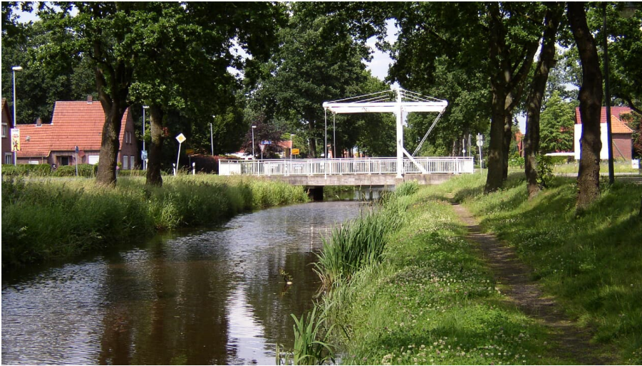
Augustfehn Kanal mit Treidelpfad