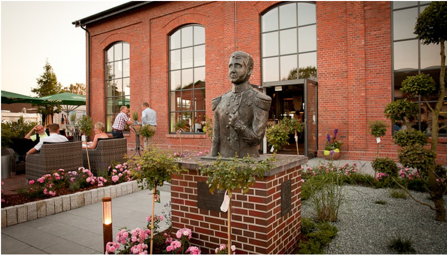
Bronzebüste Pau Friedrich August - © Foto Scheiwe