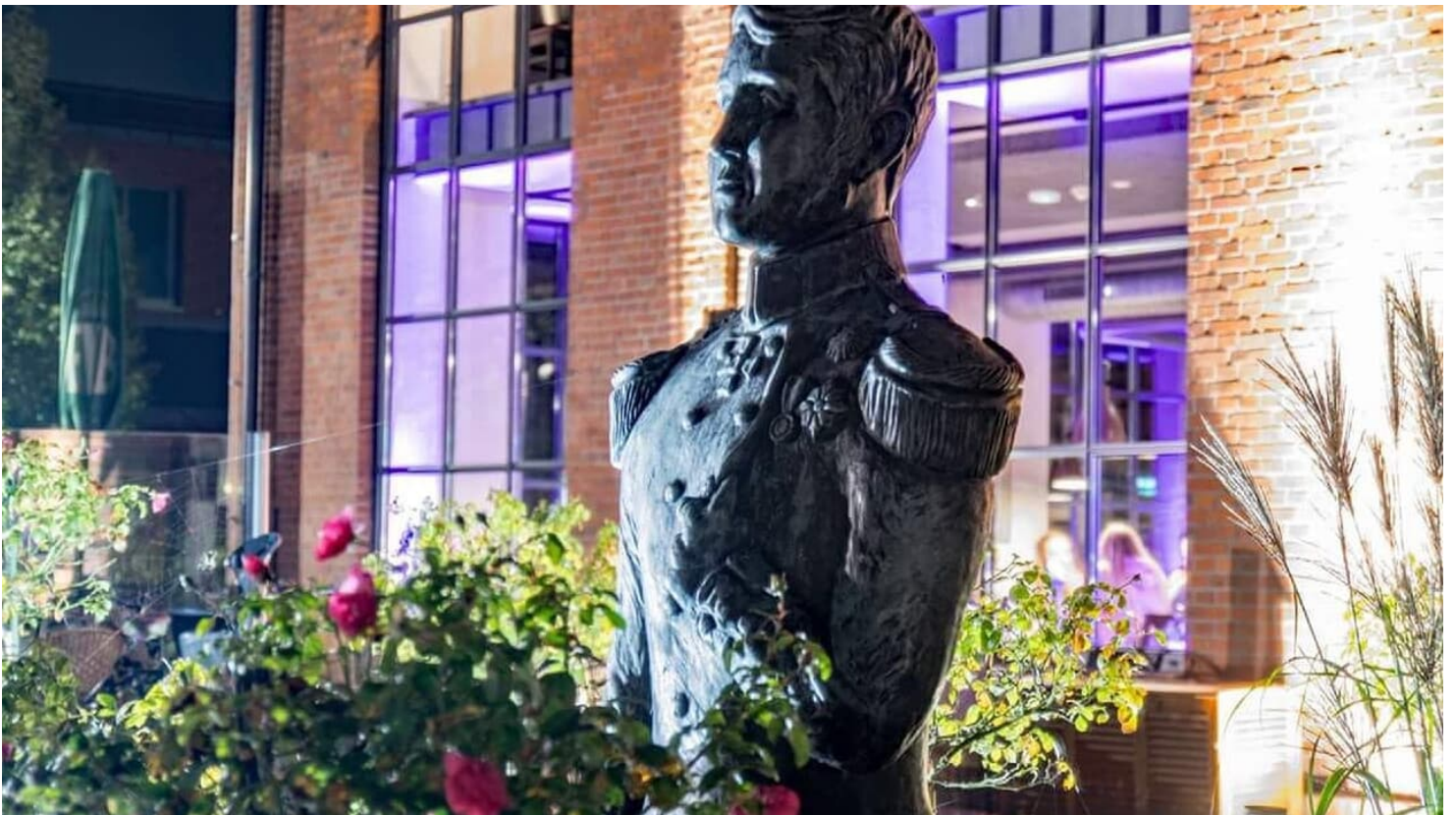
Büste Großherzog - © Marion Schäfer