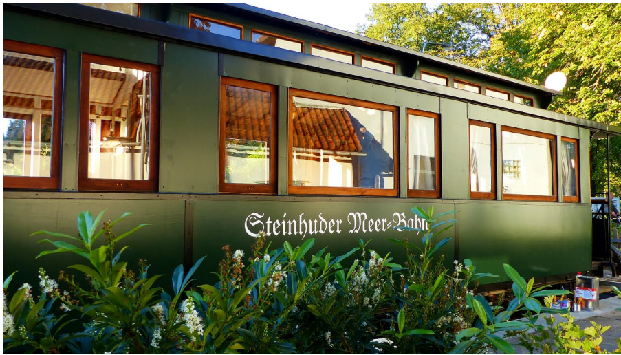
Steinhuder Meer Bahn