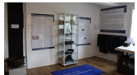
Blauruck m. Tafeln.jpg