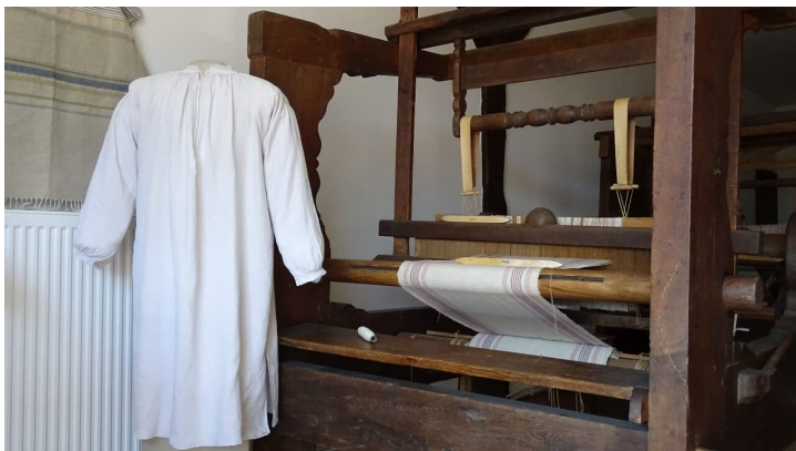
Hemd ohne Naht