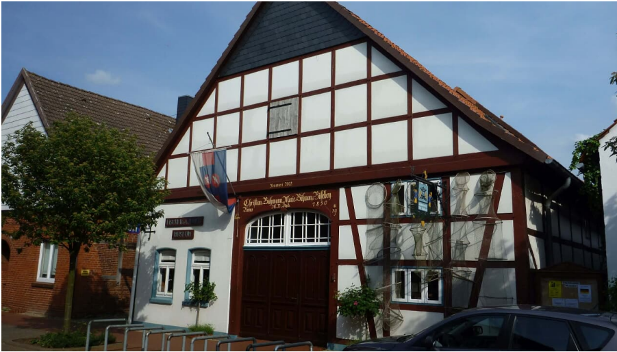
Steinhuder Museen