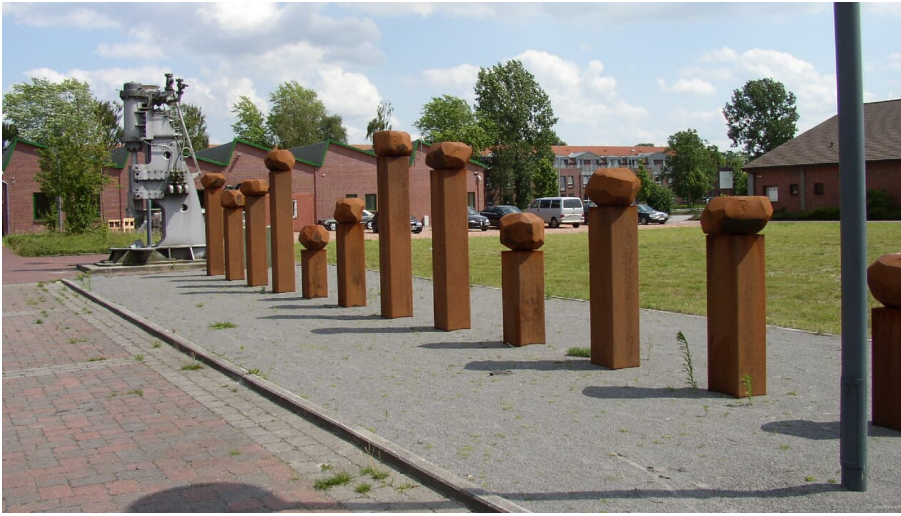
Puddelöfen Eisenhütte