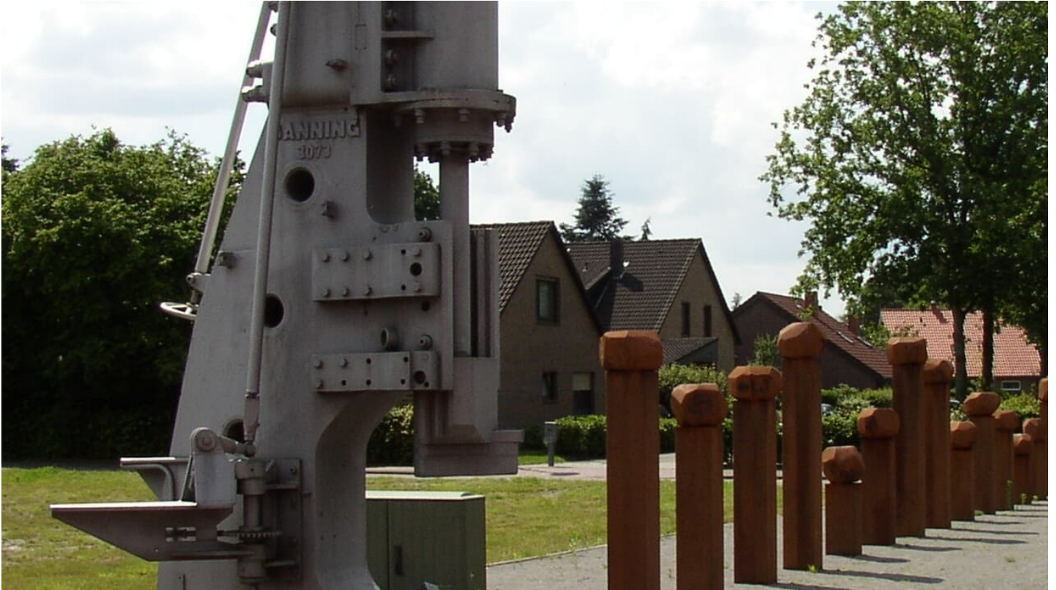
Puddelöfen Eisenhütte

ID: p_100038171 Zuletzt geändert am 25.09.2020, 10:34