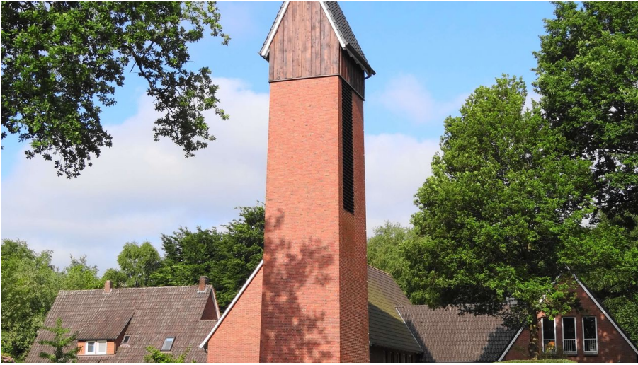
Friedenskirche Augustfehn