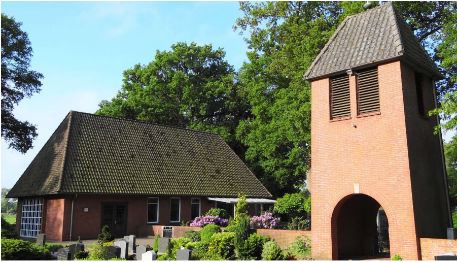
Kapelle Nordloh