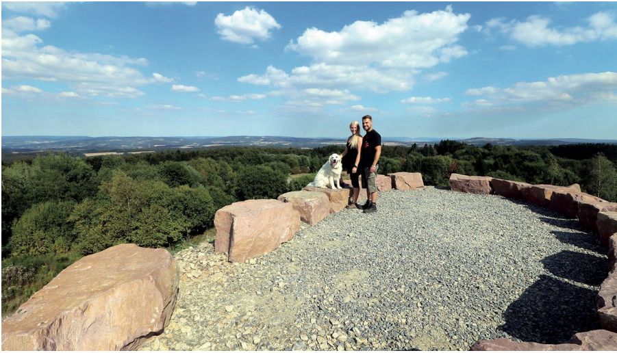
Steinberg CC BY-SA - Marketing Extertal.tiff