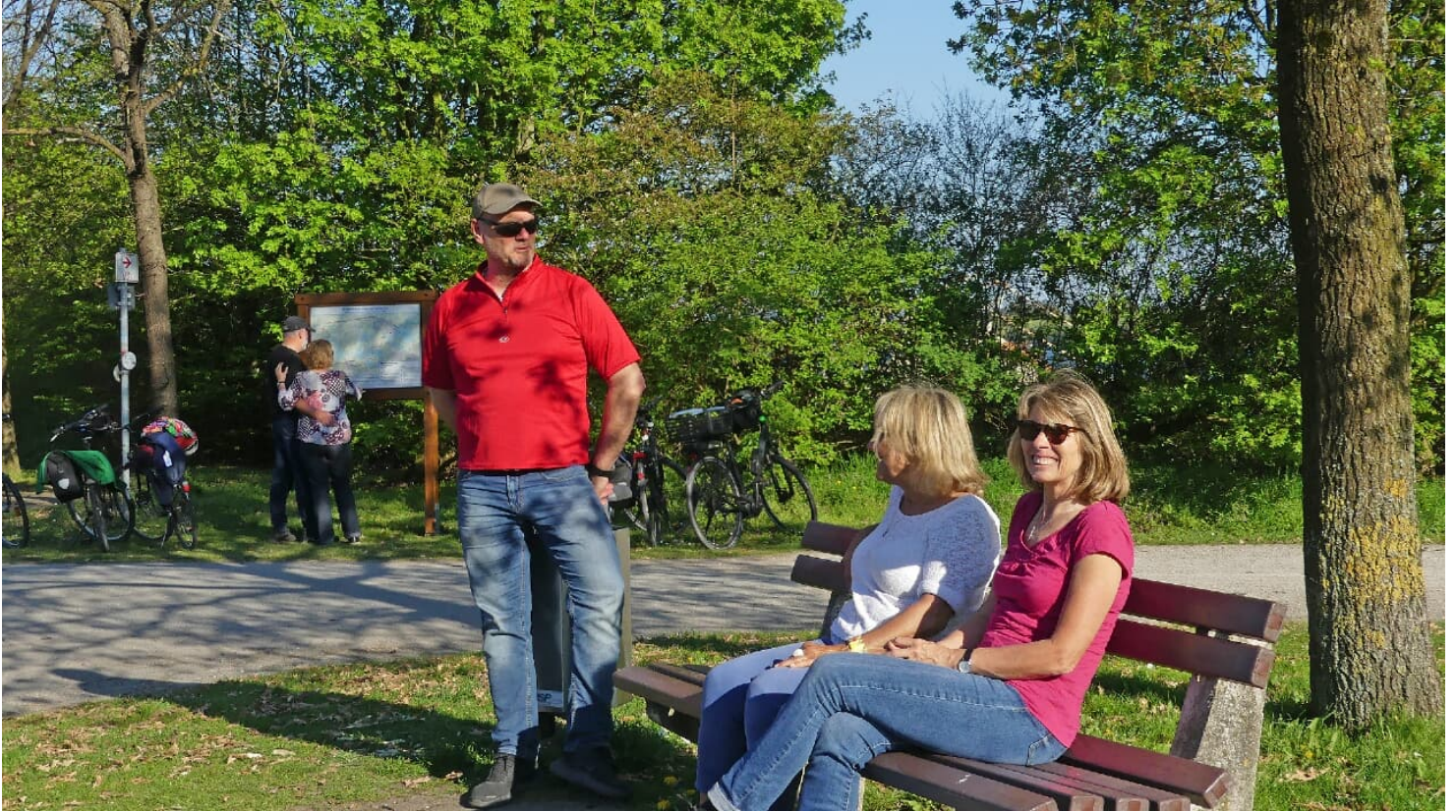
Pause vor der Tour. Im Hintergrund die Infotafel der WasserRoute.