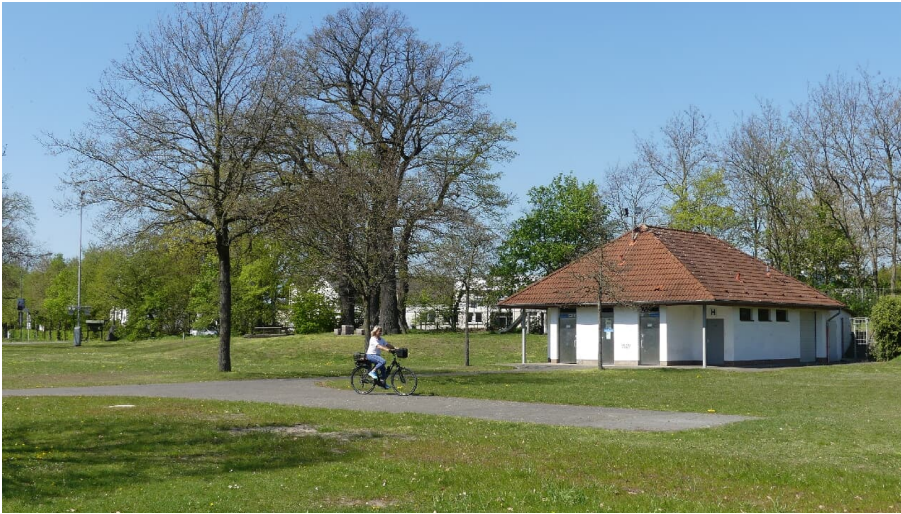
Behindertengerechte WC-Anlage auf dem Dorfplatz Sande

Der Dorfplatz in Paderborn-Sande ist Ausgangspunkt der "WasserRoute Paderborn/Delbrück". Dort befinden sich außerdem eine behindertengerechte WC-Anlage, ein Rastplatz und ein kleiner Kinderspielplatz.