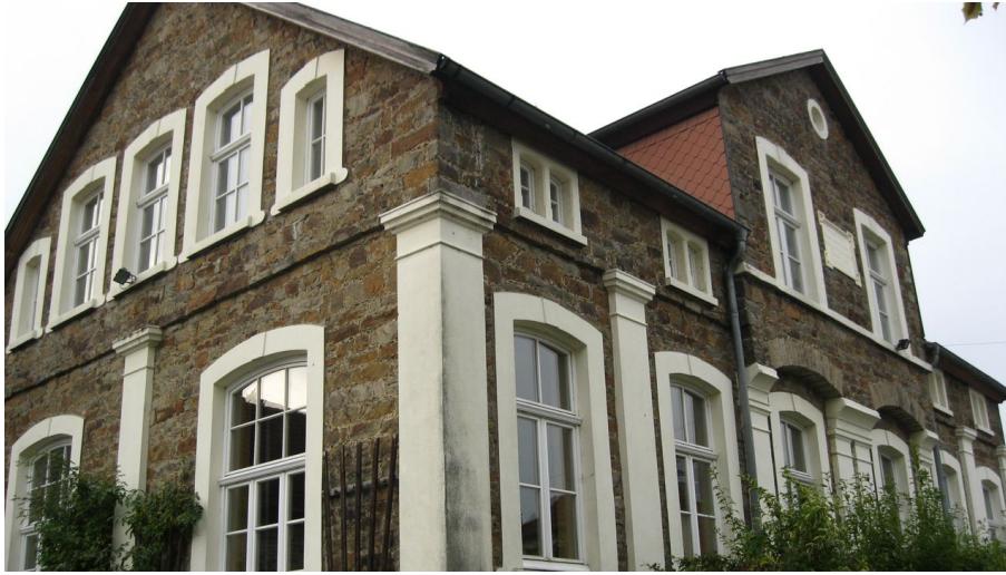
Alte Schule Almena