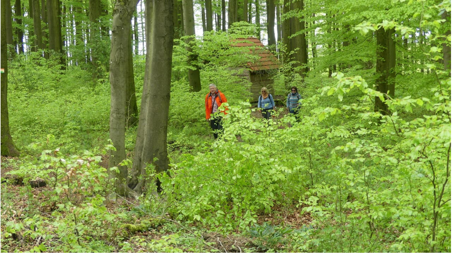
Buche mit den zwei Beinen