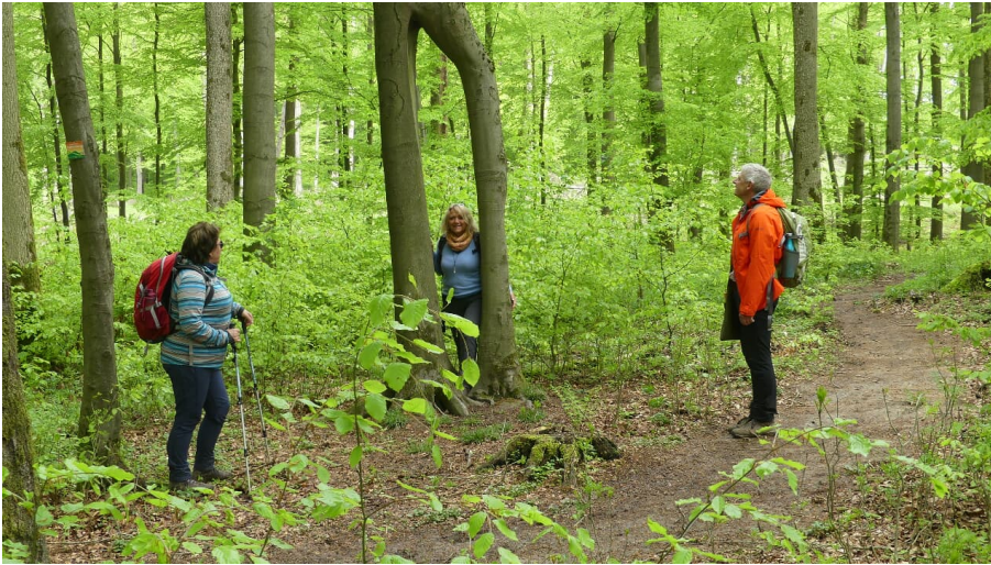
Buche mit den zwei Beinen