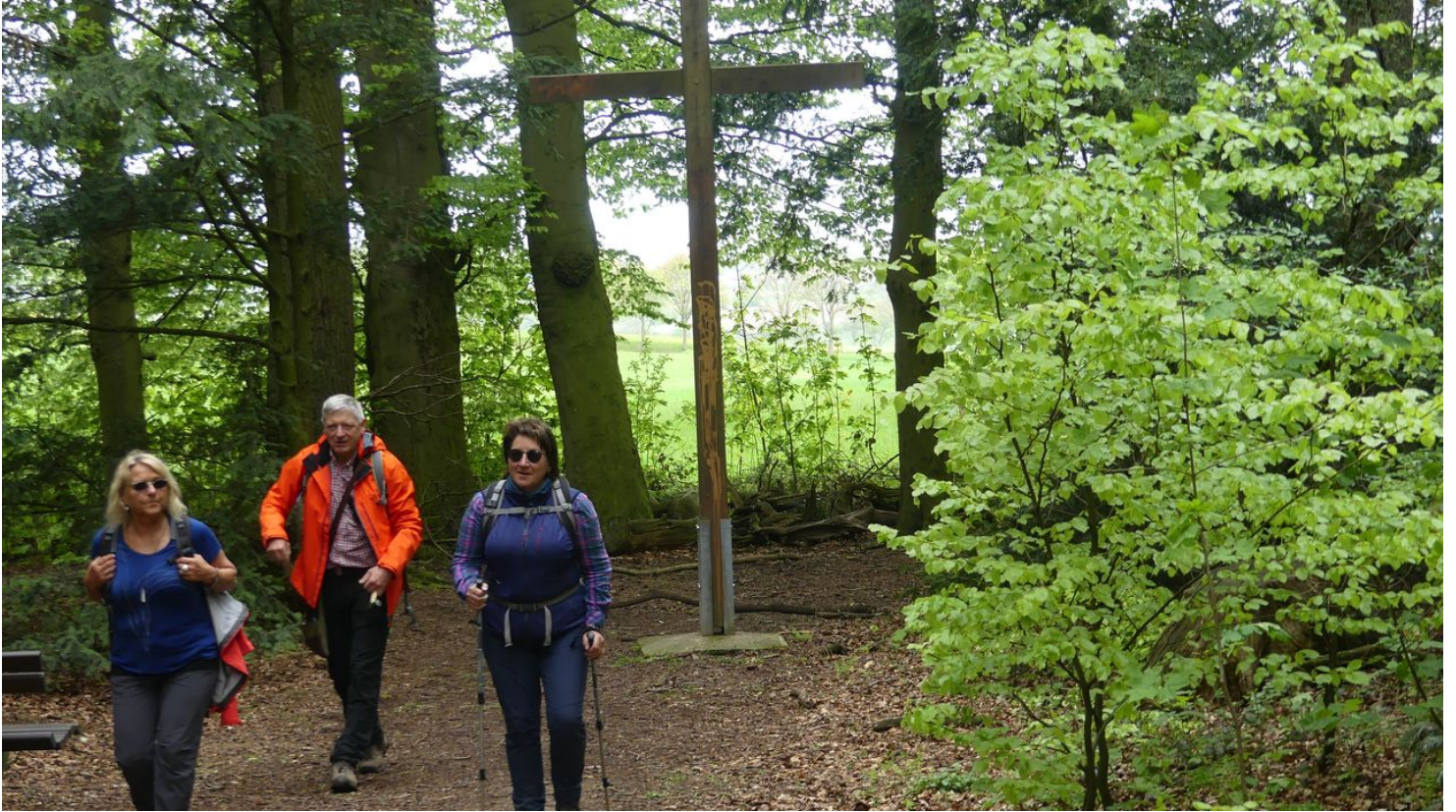
Pestfriedhof im Mittelholz