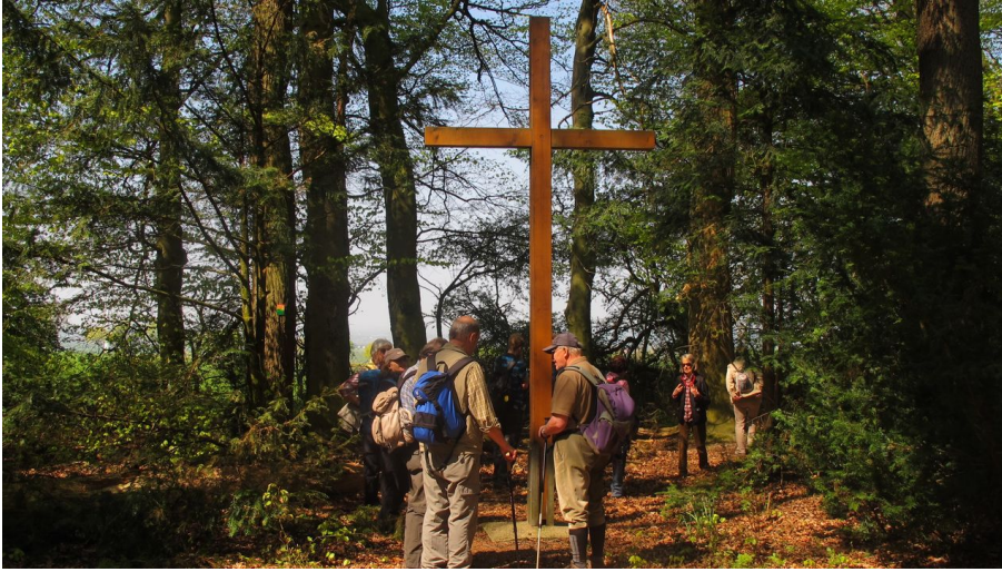
Pestfriedhof im Mittelholz