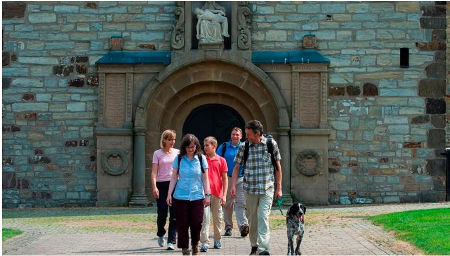
Eingangportal der Pfarrkirche Paderborn-Neuenbeken