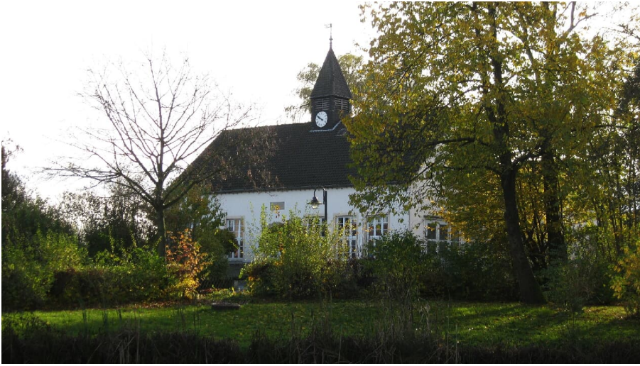
Alte Schule Laßbruch - © LAG Nordlippe, Nathalie Helling