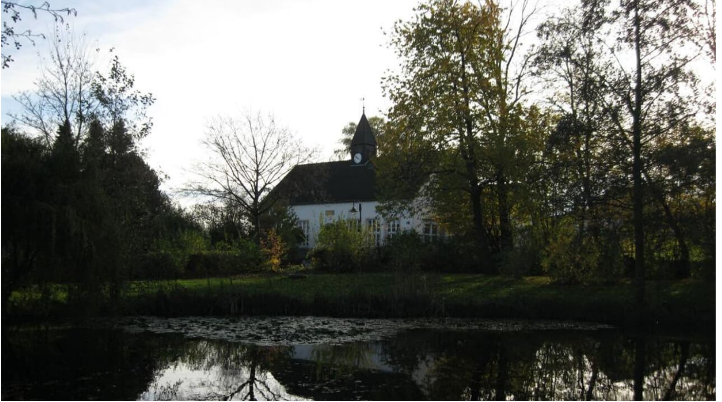
Alte Schule mit Dorfteich und Parkanlage - © Nathalie Helling, LAG Nordlippe

Quelle: destination.one ID: p_100038299 Zuletzt geändert am 01.02.2022, 14:20