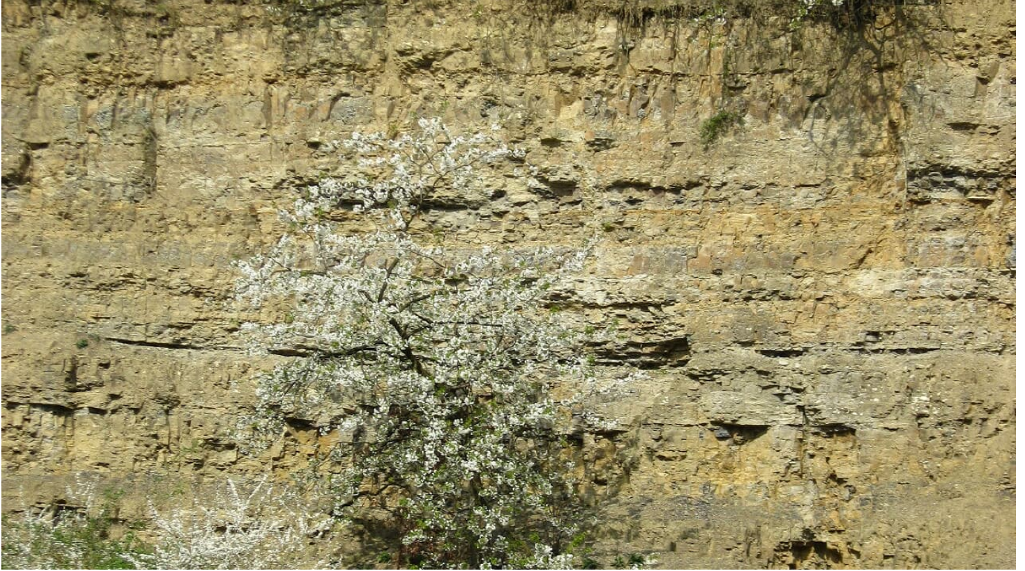
Steinbruch am Nüllberg in Extertal-Laßbruch - © LAG Nordlippe, Nathalie Helling

Quelle: destination.one ID: p_100038301 Zuletzt geändert am 01.02.2022, 14:20