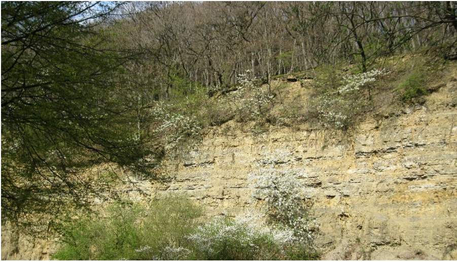
Steinbruch am Nüllberg in Extertal-Laßbruch