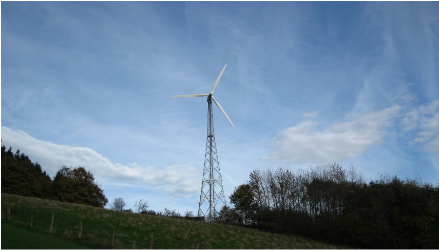
Das Windrad „SilWia“ in Extertal