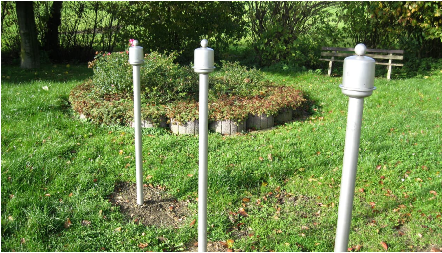
Duftorgel in Extertal-Kükenbruch

Die Duftorgel ist ein besonders sinnliches Erlebnis für Groß und Klein. Öffnet man einen Deckel, und schnuppert in kurzen, sanften Atemzügen, so dringen die Aromamoleküle über die Riechschleimhaut in unseren Körper und unser Bewusstsein. Düfte haben einen nachhaltigen Einfluss auf menschliche Emotionen und Erinnerungen. Mit den Eindrücken bestimmter Gerüche assoziieren wir besondere Erlebnisse. Mit geschlossenen Augen lässt sich am besten erforschen, welche Düfte in den Stelen der Orgel enthalten sind.