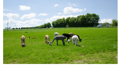
Alpakas im Ellertal