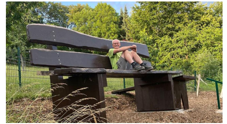
Riesenbank im Ellerbachtal