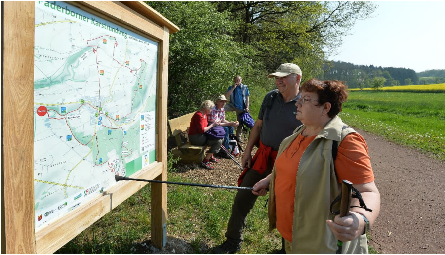
Infotafel im Ellerbachtal