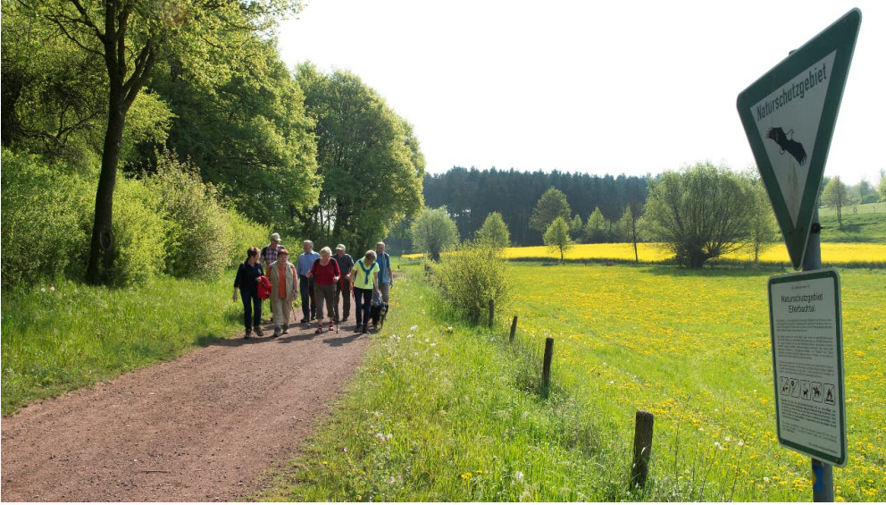
Ellerbachtal bei Paderborn-Dahl