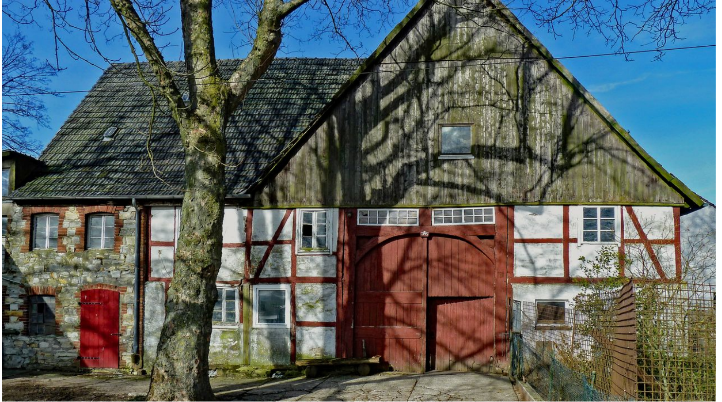
Schliphof bei der Braunsöhle - © Karl Heinz Schäfer, Tourist Information Paderborn