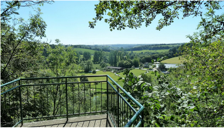
Blick vom Teufelstein über das Altenautal