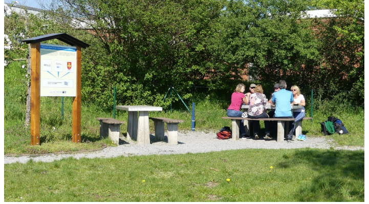
Rastplatz beim Trinkwasser-Lehrpfad