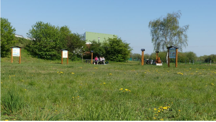
Wiese beim Trinkwasser-Lehrpfad