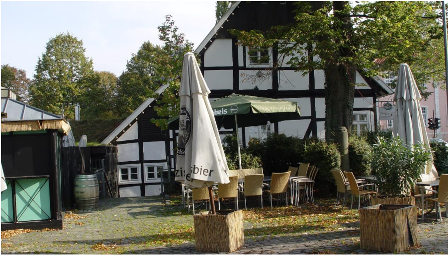
"Alte Münze" Rheda