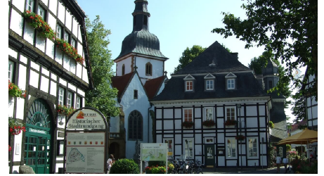
Bolzenmarkt mit Blick auf die Pfarrkirche St. Johannes Baptist und das Rathaus