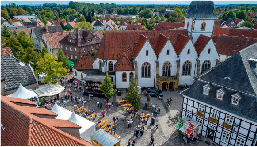
Seitenansicht der Pfarrkirche St. Johannes Baptist