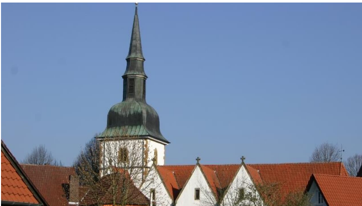
Katholische Pfarrkirche St. Johannes Baptist