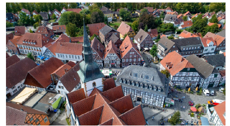
Luftansicht der Pfarrkirche St. Johannes Baptist