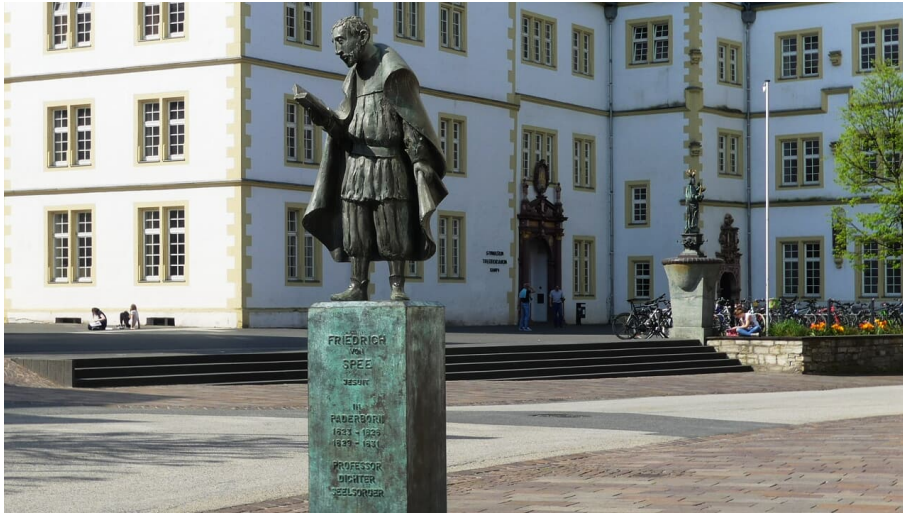
Spee-Statue vor dem Gymnasium Theodorianum