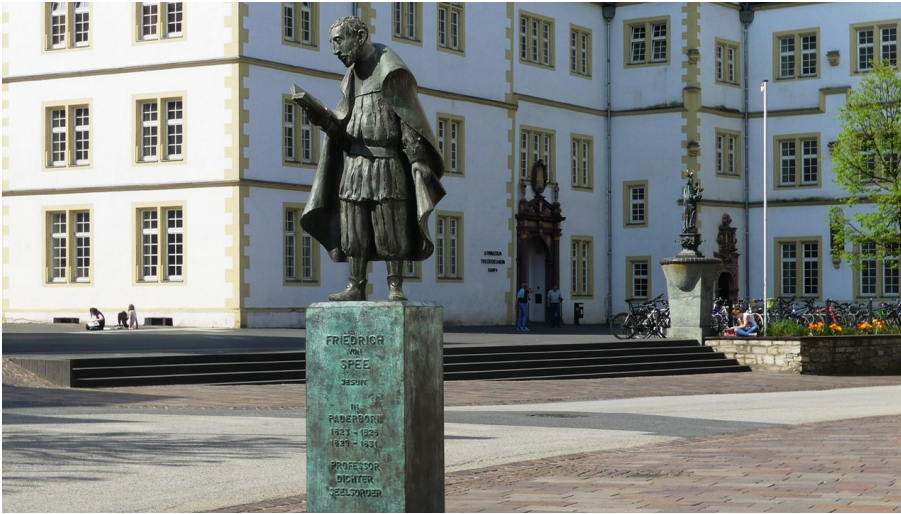
Spee-Statue vor dem Gymnasium Theodorianum