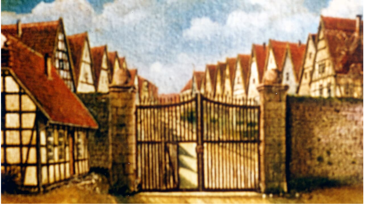
Blomberg Marketing e. V.