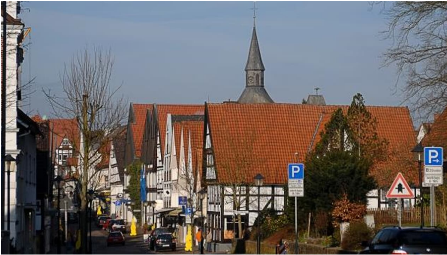
Heutorstraße / Kurzer Steinweg