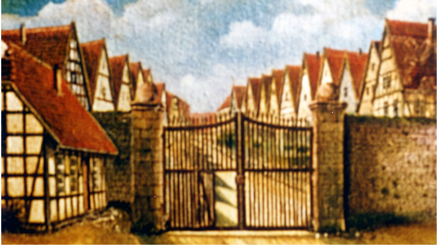
Blomberg Marketing e. V.