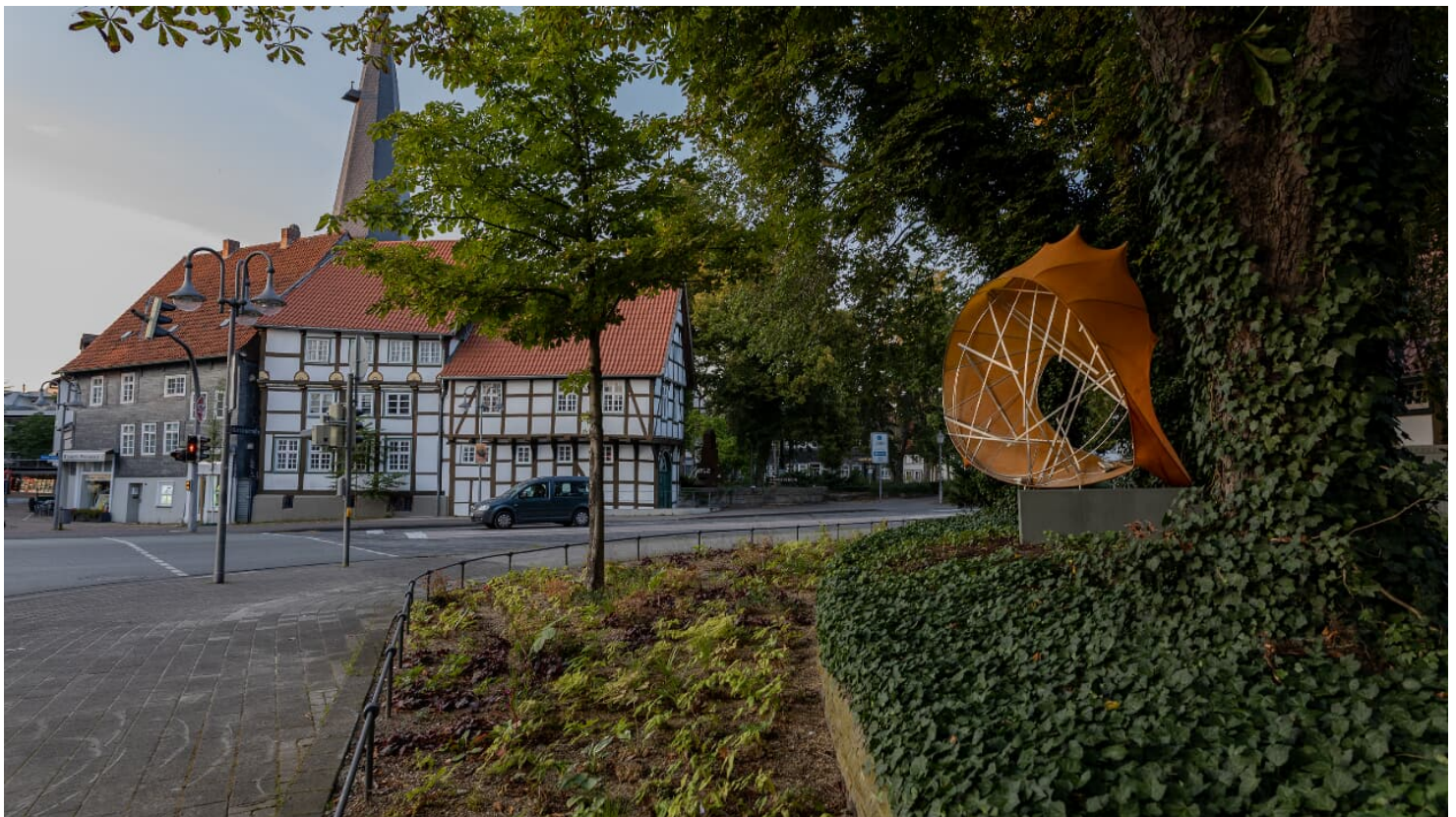
Gütersloh - blaue Stunde - © Gütersloh Marketing GmbH, Gütersloh, Lena Descher