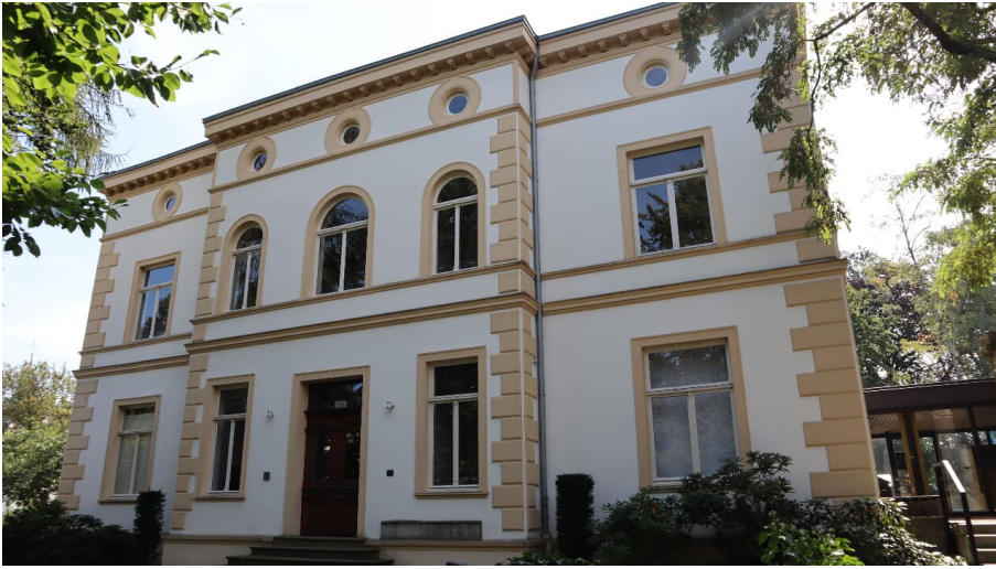
Daniel Pöppelmann Haus