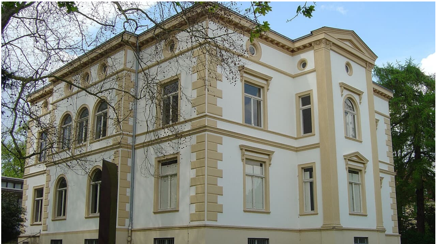
Pro Herford GmbH