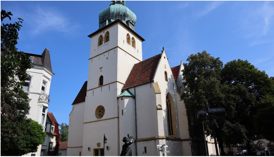
Jakobi-Kirche (3).JPG