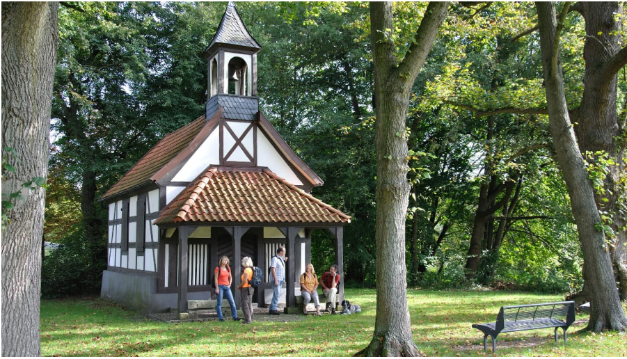
Rochuskapelle - © Karl Heinz Schäfer, Tourist Information Paderborn