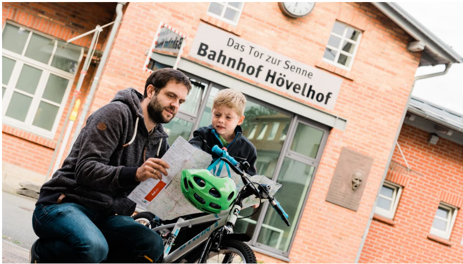
Bahnhof Hövelhof - Das Tor zur Senne - © Thorsten Hennig Fotografie