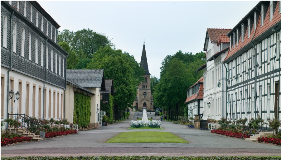
Blick aus dem Gräflichen Park auf die Evangelische Kirche

Am Ende der Hauptachse des Gräflichen Parks befindet sich die 1854 eingeweihte evangelische Kirche.