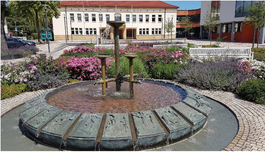
Der Dreizehnlindenbrunnen auf dem Rathausvorplatz in Bad Driburg