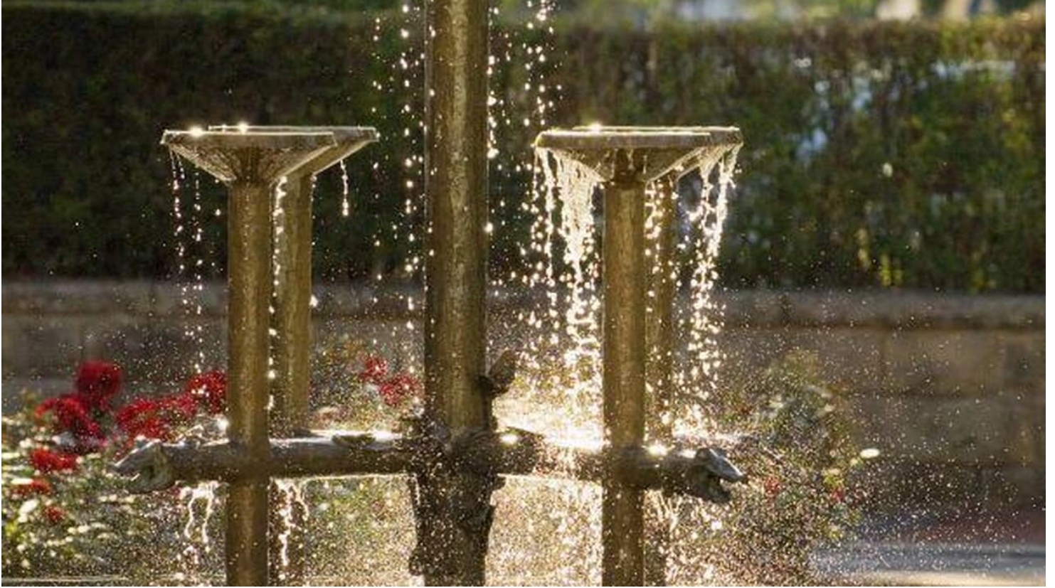
Dreizehnlindenbrunnen in Bad Driburg - © Bad Driburger Touristik GmbH, Bad Driburger Touristik GmbH

Quelle: destination.one ID: p_100038366 Zuletzt geändert am 11.04.2024, 10:15