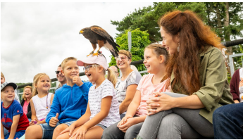
Detmold-Adlerwarte Berlebeck-Teutoburger-Wald-Tourismus-D-Ketz-049.jpg