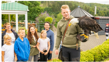
Detmold-Adlerwarte Berlebeck-Teutoburger-Wald-Tourismus-D-Ketz-047.jpg