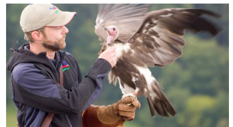
Adlerwarte Berlebeck - © Teutoburger Wald / Detmold / S. Nielsen