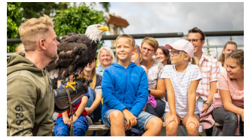
Detmold-Adlerwarte Berlebeck-Teutoburger-Wald-Tourismus-D-Ketz-055.jpg