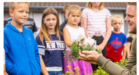
Detmold-Adlerwarte Berlebeck-Teutoburger-Wald-Tourismus-D-Ketz-042.jpg