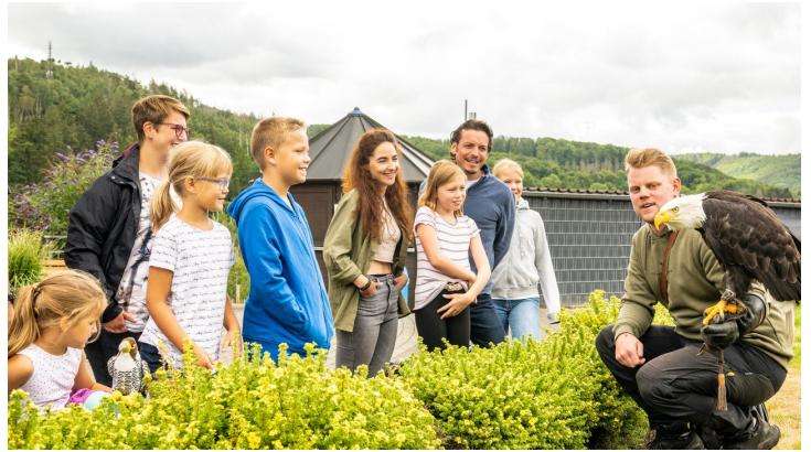
Detmold-Adlerwarte Berlebeck-Teutoburger-Wald-Tourismus-D-Ketz-044.jpg