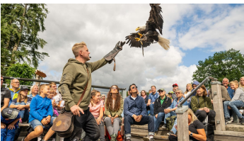
Detmold-Adlerwarte Berlebeck-Teutoburger-Wald-Tourismus-D-Ketz-054.jpg