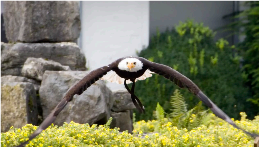
Adlerwarte Berlebeck