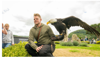
Detmold-Adlerwarte Berlebeck-Teutoburger-Wald-Tourismus-D-Ketz-046.jpg