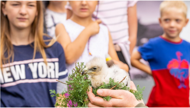
Detmold-Adlerwarte Berlebeck-Teutoburger-Wald-Tourismus-D-Ketz-043.jpg