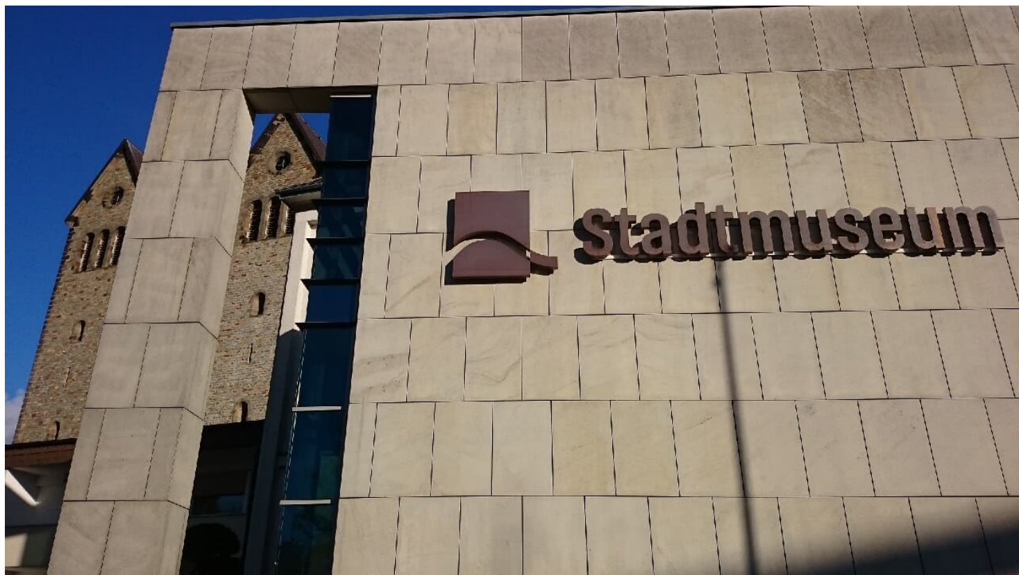
Stadtmuseum und Abdinghofkirche Paderborn

Di.-So. 10-18 Uhr 2. Weihnachtstag 10-18 Uhr Neujahr 13-18 Uhr, Ostermontag 10-18 Uhr Heiligabend, 1. Weihnachtstag, Silvester, Karfreitag geschlossen