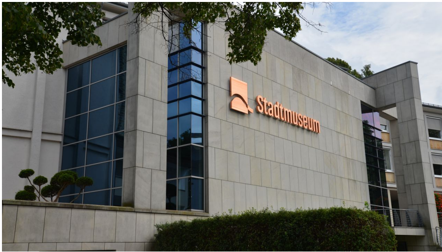
Stadtmuseum Paderborn - © Harald Morsch, Stadt Paderborn