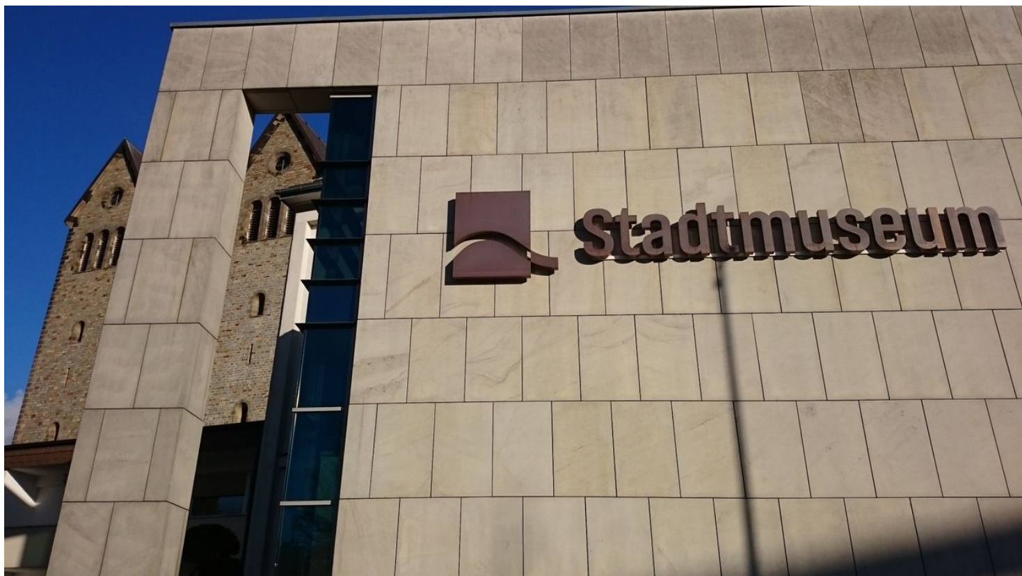
Stadtmuseum und Abdinghofkirche Paderborn

Di.-So. 10-18 Uhr 2. Weihnachtstag 10-18 Uhr Neujahr 13-18 Uhr, Ostermontag 10-18 Uhr Heiligabend, 1. Weihnachtstag, Silvester, Karfreitag geschlossen